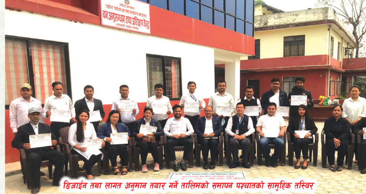
डिजाइन तथा लागत अनुमान तयार गर्ने तालिमको समापन पश्चातको सामूहिक तस्वीर