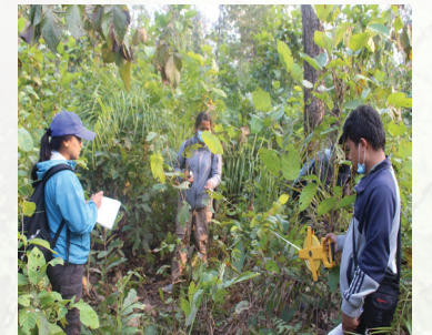
नवलपुरको चक्ला वनमा फिल्ड सर्भे गर्दै कर्मचारीहरू