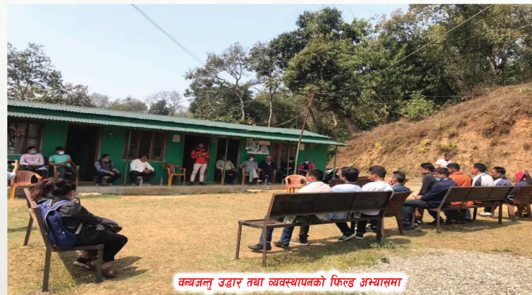
वन्यजन्तु उद्धार तथा व्यवस्थापनको फिल्ड अभ्यासमा